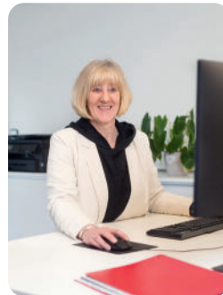
SUPPORT MIT HOTLINE