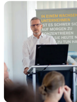
TRAINING UND SCHULUNGEN